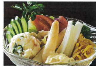
コンビネーションサラダ