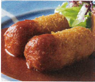
カニクリームコロッケ