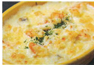
お好みマカロニグラタン