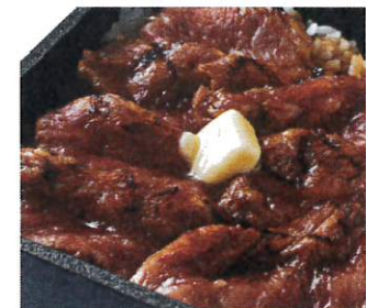
赤坂名物ビフテキ丼