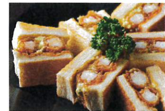
エビフライサンド